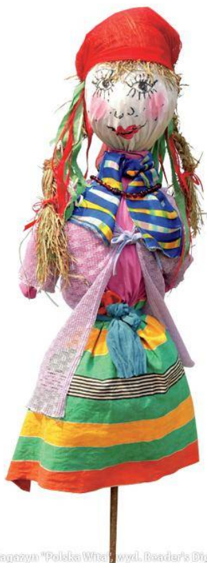
Magazyn "Polska Wita" wyd. Reader's Digest

Topienie Marzanny – zwyczaj ludowy związany z folklorem. Marzanna to nazwa kukły przedstawiającej boginię, którą w rytualny sposób palono bądź topiono w pierwszy dzień wiosny, aby pożegnać zimę. Zwyczaj ten, miał zapewnić urodzaj w nadchodzącym roku. Najpierw taką kukłę, po wszystkich domach obnosiły dzieci, następnie dorośli pod koniec dnia, wynosili ją poza granice miejscowości, podpalali i wrzucali do wody.