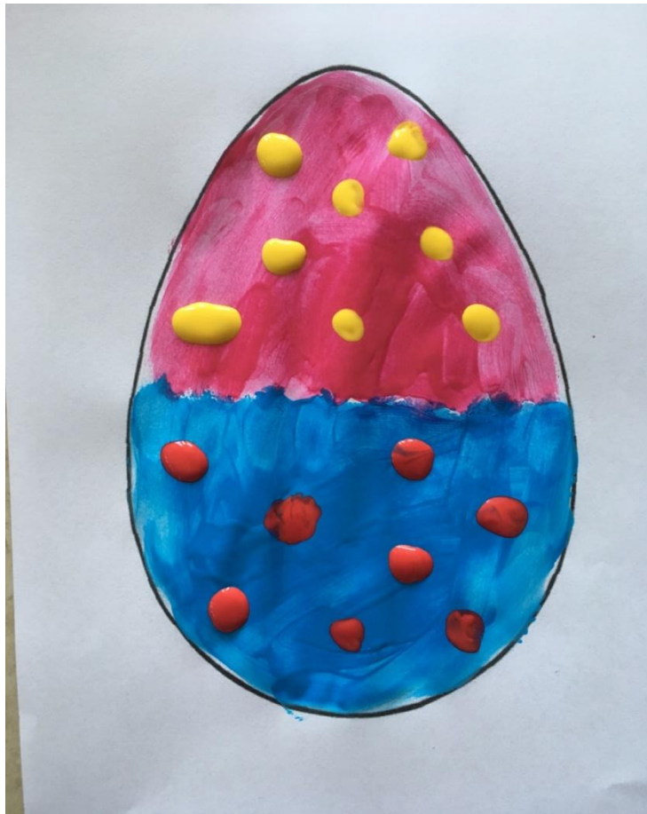
Ozdabiana kredkami pastelowymi